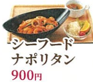
シーフードナポリタン 900円