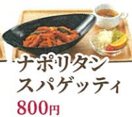
ナポリタンスパゲッティ 800円