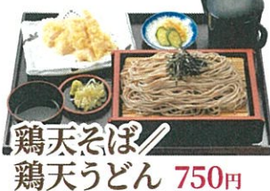
鶏天そば 鶏天うどん 750円