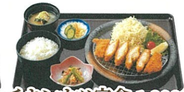
チキンカツ定食 1,000円