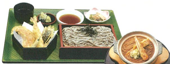
天ぷらそば御膳 1,200円