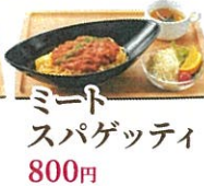
ミートスパゲッティ 800円