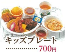
キッズプレート 700円