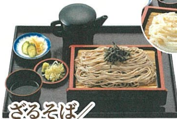
ざるそば ざるうどん 650円