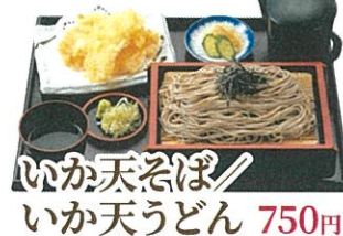
いか天そば いか天うどん 750円