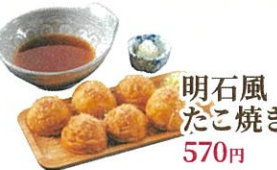
明石風たこ焼き 570円