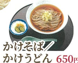
かけそば かけうどん 650円