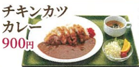
チキンカツカレー 900円