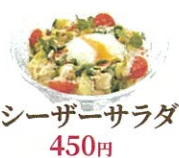
シーザーサラダ 450円