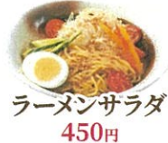
ラーメンサラダ 450円