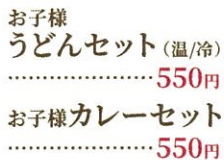
お子様うどんセット(温/冷) 550円